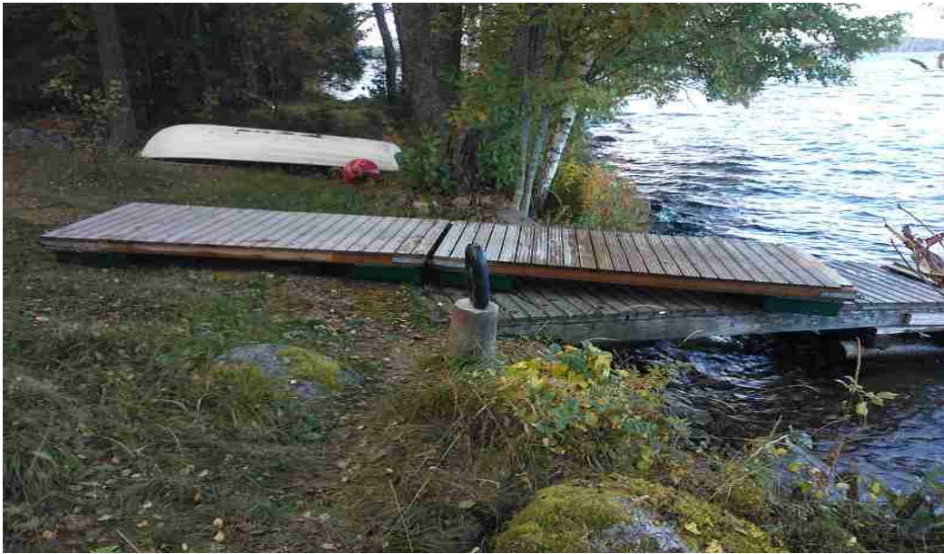
Tukikohdan laituri odottaa kevättä.

Talvella jo nähtiin kuinka laituri oli kääntynyt poikittain ja kävelysillan pää oli jään alla. Oli vähäluminen talvi ja uskottiin jäiden sulavan rauhallisesti paikoilleen, mutta toisin kävi: Jäät sulivat aikaisin ja melojat ilmoittivat jo pääsiäisenä, että meidän laituri oli siirtynyt pois paikoiltaan kohti saaren kärkeä.