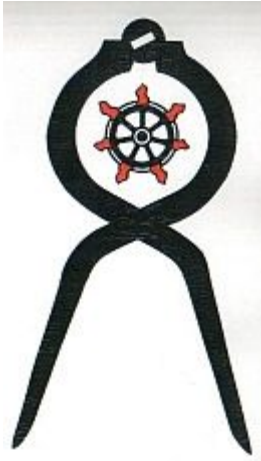
Lahden Navigaatioseura ry